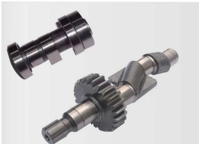
工程机械用主轴、齿轮轴 Spindles and gear shafts for construction machinery