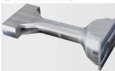
船用柴油机连杆 Connecting rods for marine diesel engines