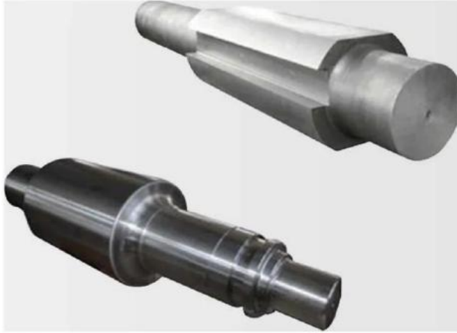
各类大型冶金设备配套轧轴、支承轴锻件 Various types of large-scale metallurgical equipment supporting rolling and supporting spoke forgings