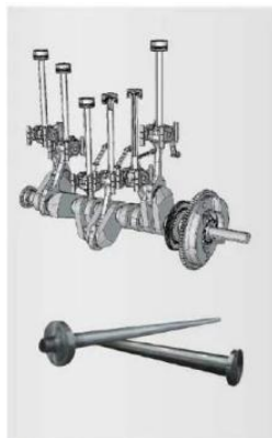
船用艉轴 Marine stern shaft